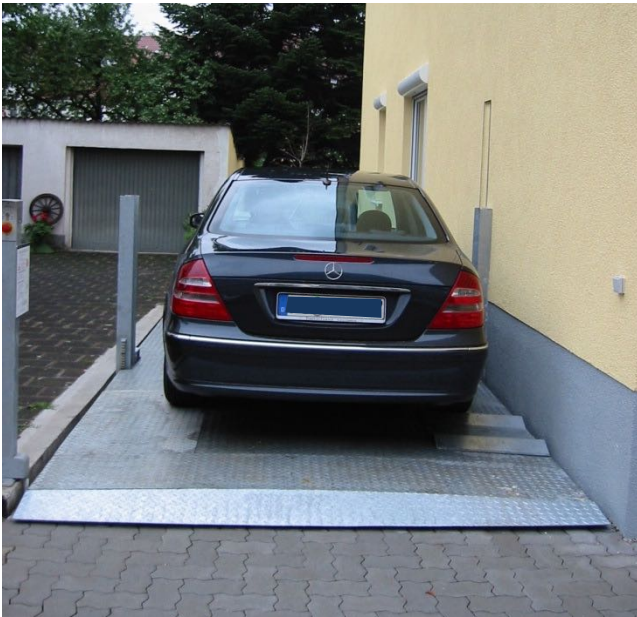
Versenkgarage mit überstehendem Ständer. Oberer Belag: Tränenblech